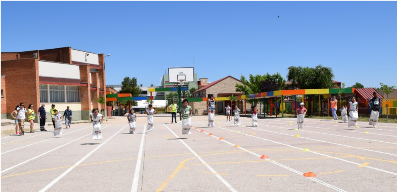
Algunos de los participantes durante la carrera de sacos.

El pasado sábado 1 de junio se celebró en la localidad de El Molar (Comunidad de Madrid) la I Gymkana Infantil organizada por el Club de Senderismo Sendas y Caminos El Molar junto a Cruz Roja Española Asamblea Comarcal del Jarama y Cáritas El Molar . Coincidiendo con las fiestas patronales en honor a Nuestra Señora del Remolino, más de cincuenta niños disfrutaron de una serie de juegos y actividades al aire libre en las instalaciones del colegio que lleva su nombre. Hacerles partícipes de las fiestas en un entorno al aire libre en el que se potenciase la cultura del deporte en montaña (como es el senderismo) y educar en el medio ambiente y el reciclaje fueron los principales propósitos que impulsaron a los mencionados colectivos a organizar esta primera gymkana.