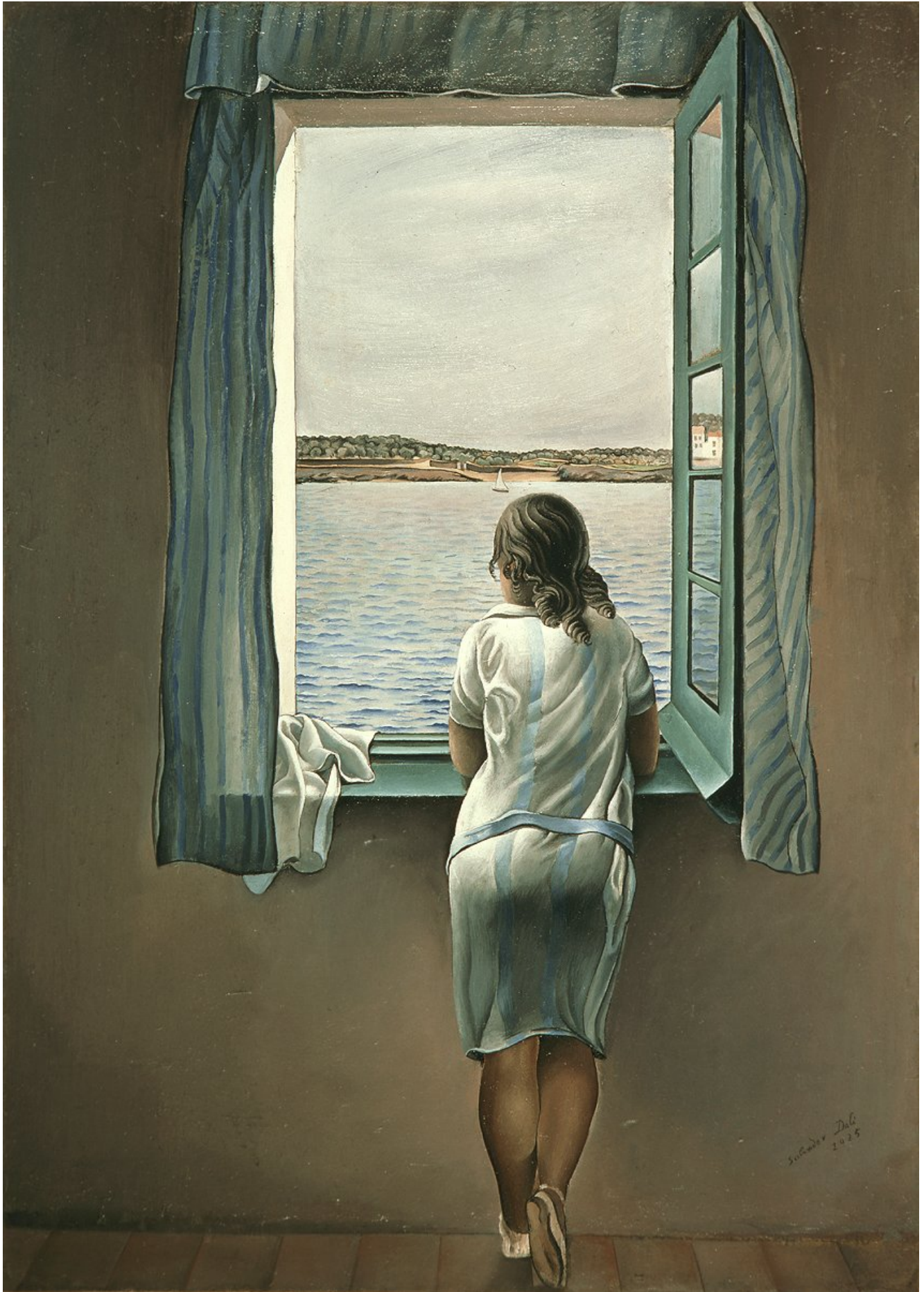
«Muchacha en la ventana». Salvador Dalí, 1925.