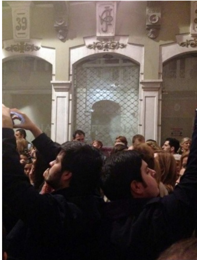
Los Pérez-Bódalo haciendo de las suyas.